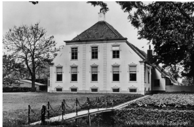
Zeeburg Noordpolder 4