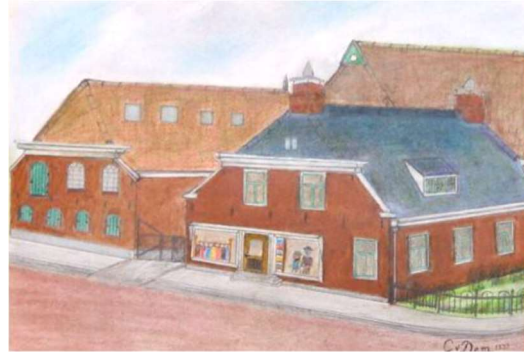
Vlasfabriek aan de Schoolstraat door Cor van Dam.