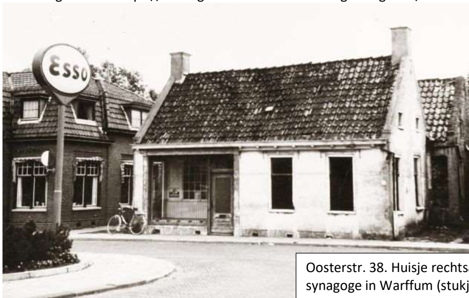
Oosterstr. 38. Huisje rechtsachter is de 1 e synagoge in Warffum (stukje van te zien).