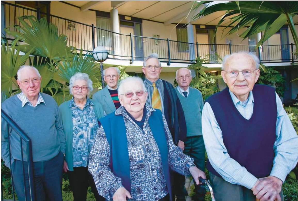
Een aantal bewoners van de woongroep Warfumburen.