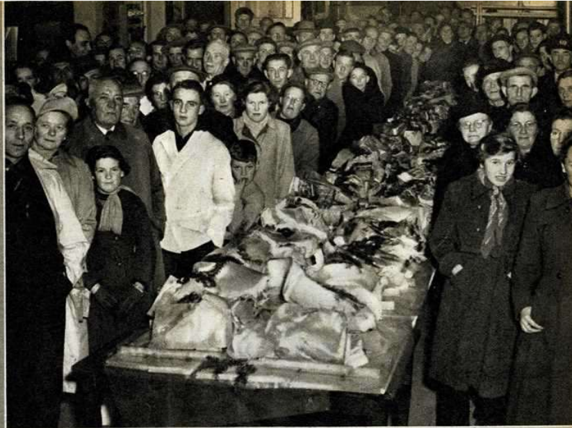
Staanste horen de leden van de Spekclub de openingsrede van de burgemeester aan.

Vroeger was het een club die voornamelijk minder draagkrachtigen onder haar leden telde. De contributie bedroeg toen maar één kwartje per week. Hetgeen niet wegnam dat in die vooroorlogse tijden één portie wel veertig tot vijftig pond omvatte. Maar met het stijgen der prijzen zijn de porties kleiner geworden; groter echter werd het saamhorigheidsgevoel dat de leden van de club bindt.