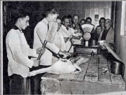
Het verdelen van het vlees, in porties van 22 pond, onder toezicht van bestuur en controleurs.