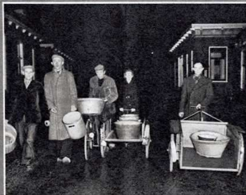
Met fietsen en handwagens, tellen en wasketels óp naar de plaats van de uitdeling.