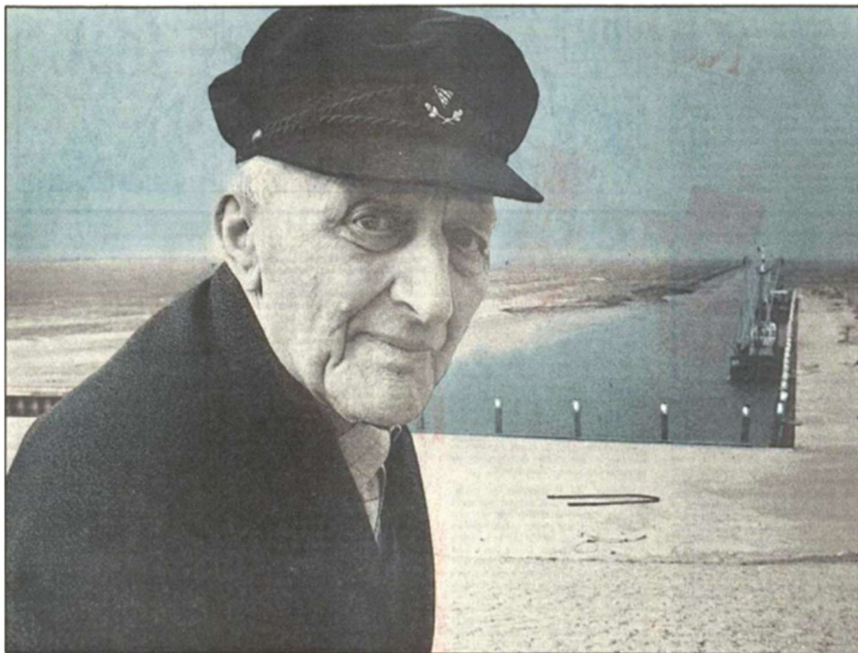
Ko Teerling uit Nieuwsblad van het Noorden van 12 maart 1983.