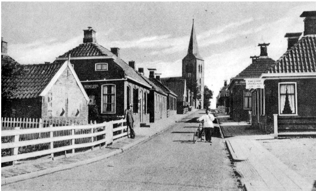
Warffum, Torenweg, plm. 1930.

Een tijd later viel de Duitse groep uit Pieterburen het huis aan de Torenweg binnen. Het doel was het vinden van een radio. Na intensief speuren werd er geen radio gevonden. Wel waren de Duitsers verbolgen over het feit dat er een foto van de koninklijke familie aan de wand hing. Zowel Jan als onderduiker Sijtsema van Uithuizen die ook aanwezig was, werden met rust gelaten, omdat beide over de nodige bewijzen beschikten. Het waren echter wel spannende momenten vooral wanneer je daarbij met geweren onder schot wordt gehouden.