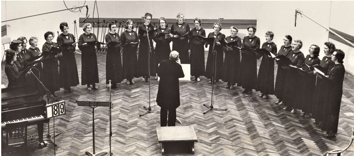
Belcanto in 1979 in een optreden voor de AVRO.