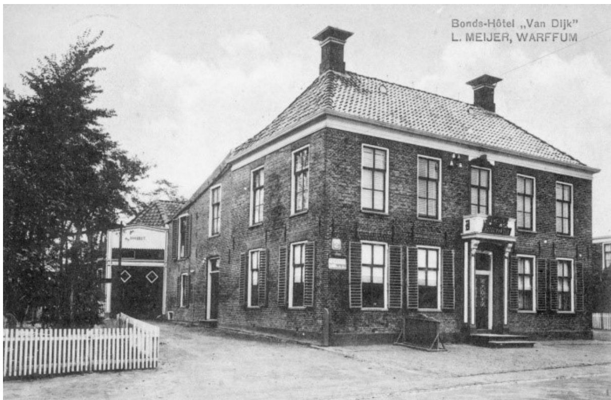
Hotel aan de Noorderstraat waar bovenstaand verhaal zich deels afspeelt.