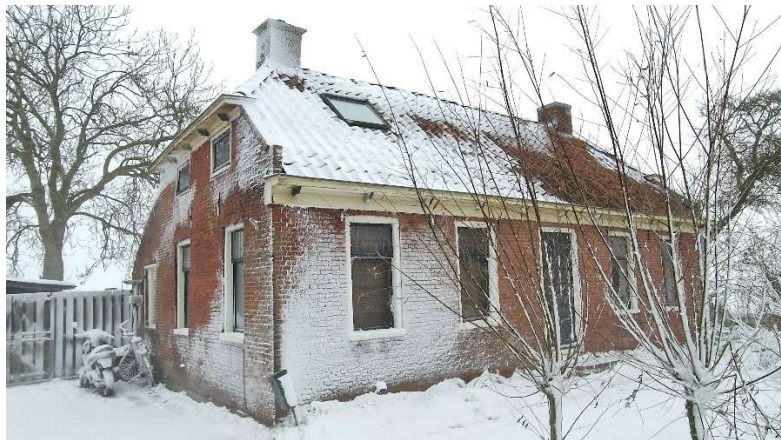
Foto bij gelegenheid van het 60-jarig huwelijk van Scholtens en Meijer in 1980. In 1990 werd het 70-jarig huwelijk gevierd.* Hun huis Molenweg 20 nu.